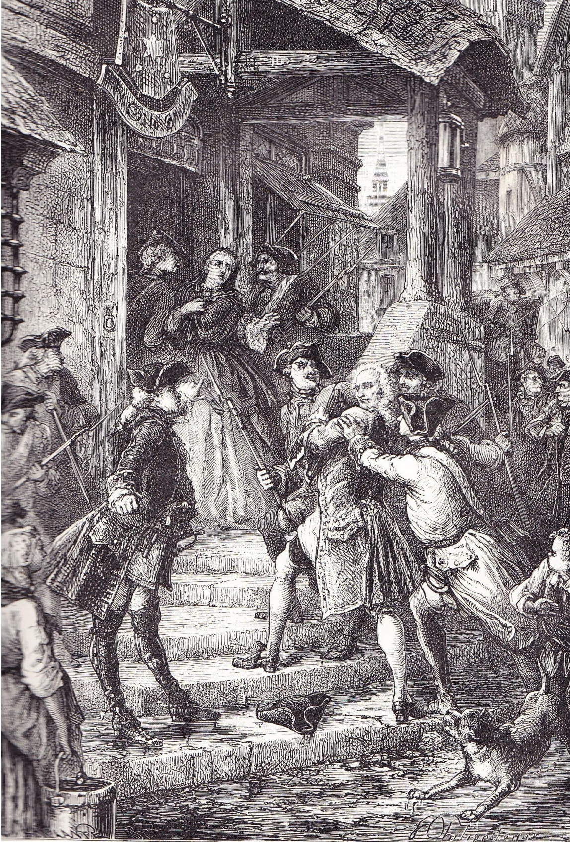
VOLTAIRE ARRÊTÉ A FRANCFORT PAR ORDRE DU GRAND FRÉDÉRIC.

«Voltaire arrêté à Francfort par ordre du Grand Frédéric»