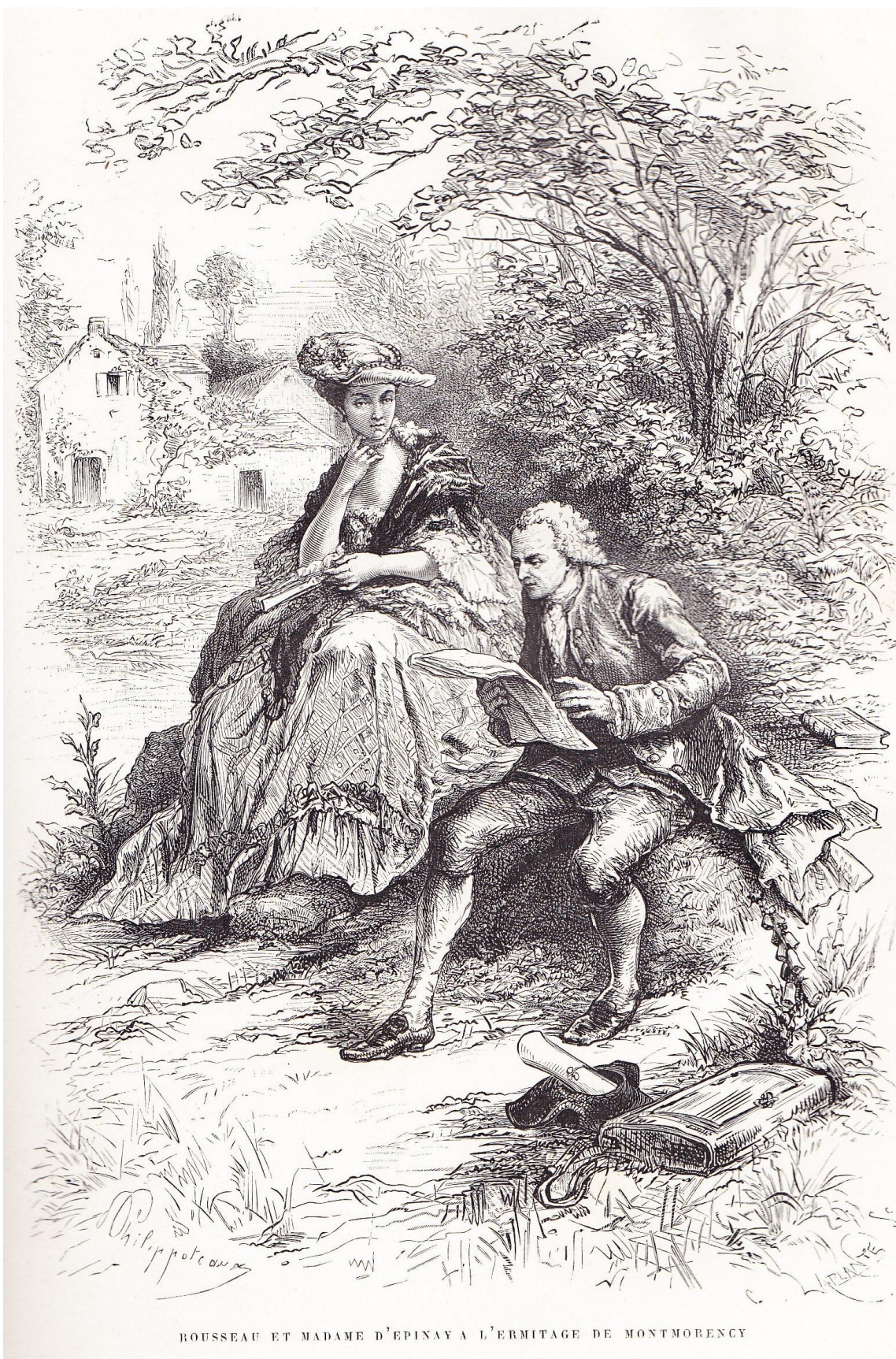
ROUSSEAU ET MADAME D'EPINAY A L'ERMITAGE DE MONTMORENCY

«Rousseau et Madame d'Epainay à l'ermitage de Montmorency»