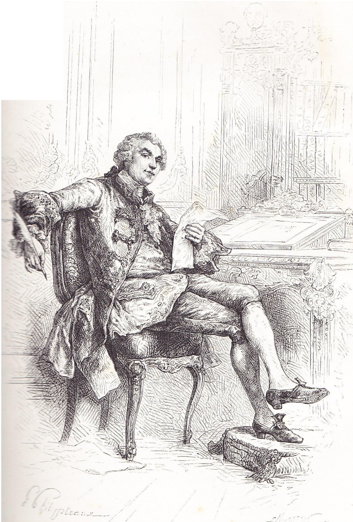
BUFFON (JEAN-LOUIS LECLERC, COMTE DE)